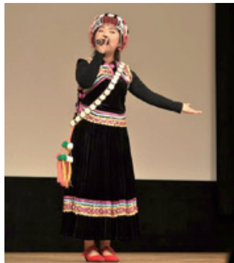
▲歌を披露するリス族の大学生