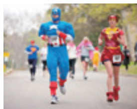
▲スーパーヒーローラン

Running USA ホームページから引用 http://www.runnersworld.com/general-interest/charity-running-more-competitive-than-ever?page=single