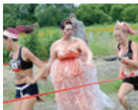
▲ゾンビラン

そのほか、様々なテーマでレースが催されます。例えば、「カラーラン」「ゾンビラン」「スーパーヒーローラン」などです。カラーランは参加者が白いシャツを着用し、レース中に4色のカラーパウダーのシャワーを浴び、ただ楽しむためのレースです。ゾンビランはゾンビの仮装をした人から逃げるといったコースレースで、スーパーヒーローランは参加者がスーパーヒーローの仮装をして走ります。先月のテーマと引き続き、アメリカではチャリティー目的とともに楽しむ傾向があります。