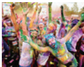
▲カラーラン