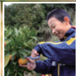
山田小学校の児童のミカン狩りの様子。 甘くておいしいミカンにみんなにっこり。