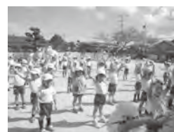
《七五三・千歳あめもらったよ》