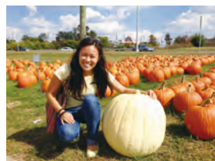
▲パンプキン畑にて

長の促進を、トウモロコシの葉がスクウォッシュの成長を促進させる役割を果たしていました。現在は、パンプキン畑で家族とパンプキン狩りをしたり、パンプキンの中身をくり抜いて調理したりします。調理で残った皮の部分で子ども達が提灯 てんとう を作ることが一般的です。