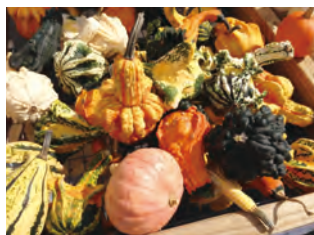
▲様々なスクウォッシュ

スクウォッシュはアメリカの先住民(ネイティブアメリカン)の「三姉妹」の中の野菜です。「三姉妹」とは、ネイティブアメリカンが最初に植えた野菜であるトウモロコシ、豆そしてスクウォッシュのことです。昔は、この三つの野菜を一緒に植えることで、トウモロコシの茎が豆の成