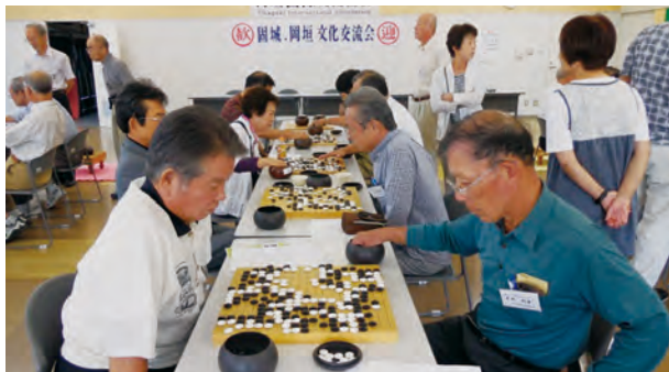
(囲碁大会での様子)