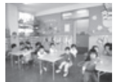
《お友達一杯できたよ!》