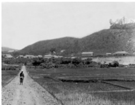
郡道海老津駅～原線の道路が出来たばかりの駅前商店街通り(明治44年頃)

この間、盛況だった海老津炭鉱や高陽炭鉱が閉山後、炭鉱跡地の宅地造成をきっかけに、東部地域の開発が進み、丘陵山地が住宅団地となり、町の東部から中部にかけては、往昔の農村の面影はなく、住宅街化している。かつては純農村だった岡垣が、これだけ人口が増え一大消費地域となったいま、今後の課題は、産業を含むこれからの町民の生活基盤をどう確立できるかであろう。