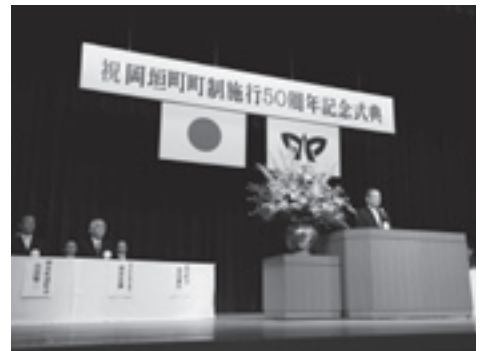
町民みんなで祝った町制施行50周年記念式典