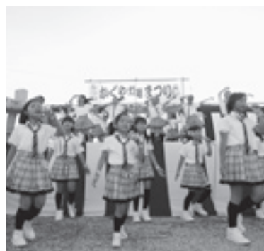
50周年記念事業を盛り上げた OKG51