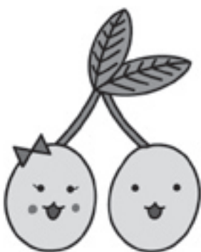
イメージキャラクターとして 誕生した「びわりん&びわすけ」