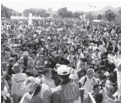
多くの人で賑わったまつり岡垣