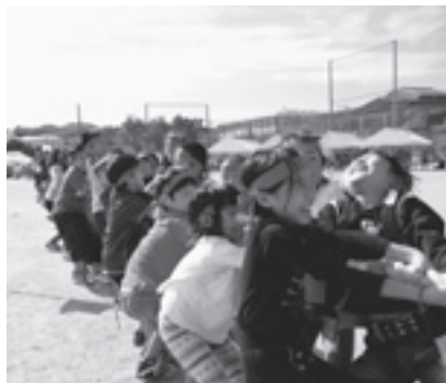
20年ぶりに開催された町民運動会