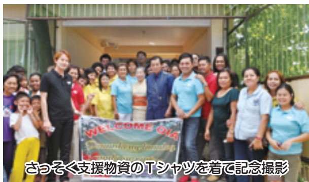
さっそく支援物資のTシャツを着て記念撮影