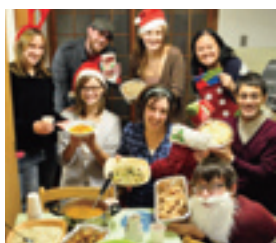
▲今年は、福岡に住む多くの外国の人が参加します！

今年のクリスマスポットラックパーティーでは、ジャマイカ人、スコットランド人、アイルランド人など福岡に住む多くの外国の人が参加し、ゲームやダンスで盛り上がること間違いなしです！お楽しみに！