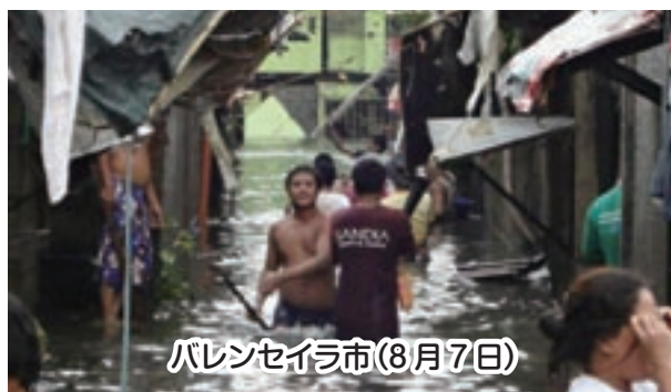
バレンセイラ市(8月7日)

多くの人たちが救援活動を行う中、OIA では義援金を送り、被災者に米などの食料品を配ることが出来ました。現在も OIA では、バレンセイラ市に送る義援金や夏物衣料、タオル、せっけんなどの物資を受け付けています。バレンセイラ市が一日も早く復興し、以前のような生活に戻ることを願っています。 問い合わせ 岡垣国際交流協会 ☎ 282-0549 へ