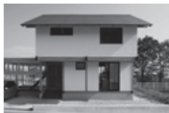
写真 200年住宅 HABITA のみんなの家より

環境に配慮した新築住宅工事 リフォーム工事全般 (キッチンやお風呂などの設備の取替やエコリフォームが人気です！) 太陽光パネル設置工事