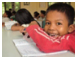
▲孤児院で授業中の子ども

滞在中、何よりも印象深かったのはカンボジアの人たちの笑顔や温かい心でした。カンボジアの田舎でホームステイしてみると「素朴で幸せな生活をしている」と感じました。もちろん色々な社会問題もありますが、カンボジアにしかない新鮮さがとても魅力的でした。それは物、お金を中心にするのではな