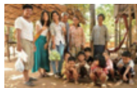
▲ホームステイ先の家族と一緒にカンボジアの人たちを見て思いました。

く、希望や夢が中心になっているからだと思えました。お金があるから幸せになるのではないのだ、という気持ちを輝いてい