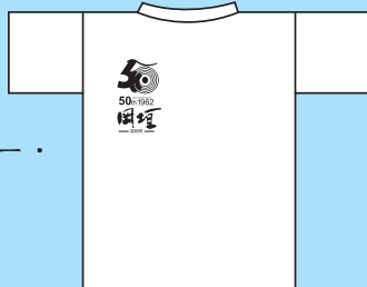
※プリントは背面のみ