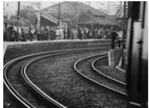
▲海老津駅のホーム(昭和49年ごろ)