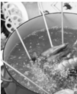
①使い終わった油は