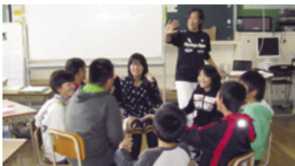
ゲームを楽しむ児童たち