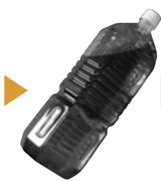
②ペットボトルに入れて