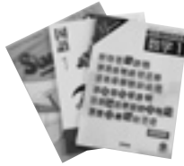
新しい教科書の一部