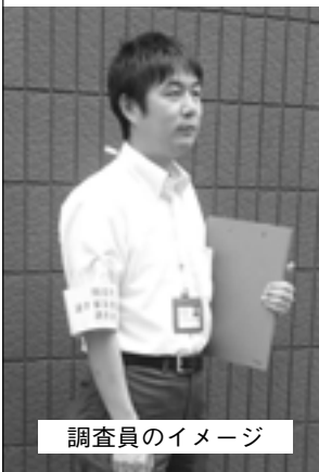
調査員のイメージ

調査員は赤色のケースに入った身分証と黄色い腕章 を付けています。調査員を見かけたときは、協力をお 願いします。