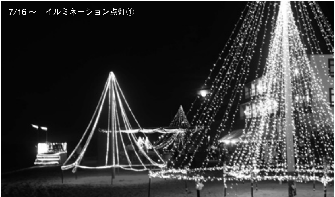
7/16 ~ イルミネーション点灯①