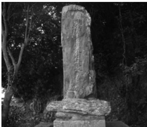
▲吉木熊野神社境内の海妻甘蔵慶寿碑