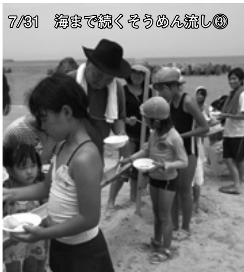
7/31 海まで続くそうめん流し③