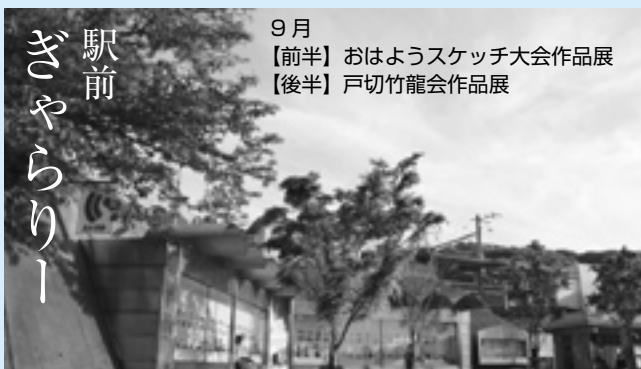
9月 【前半】おはようスケッチ大会作品展 【後半】戸切竹龍会作品展