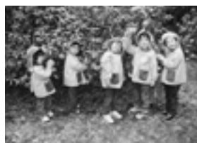
《大きなみかんがい〜っぱい》