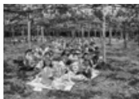
《ぶどう畑でおべんとう》

TEL (093) 282-0247 http://www.okagakichuoyoutien.com