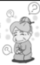
認知症が進むのではないかと不安?