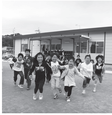
◀山田第二児童保育所