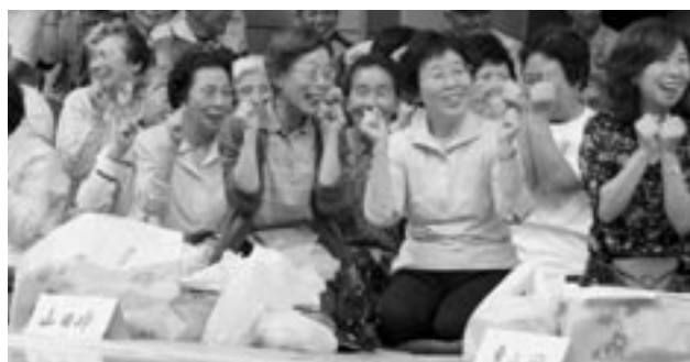
▲いつまでも元気に長生き!(高齢者スポーツ大会)