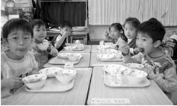
▲給食、おいしいよ(吉木小学校)