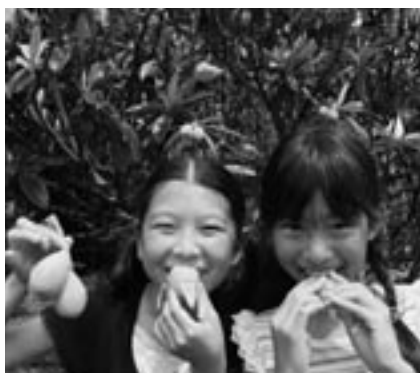
ビワの収穫シーズンです