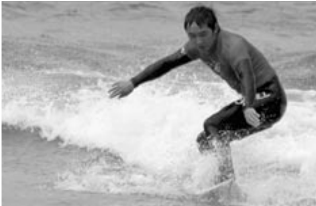
▲悪条件の中、選手たちは全力で技術を披露