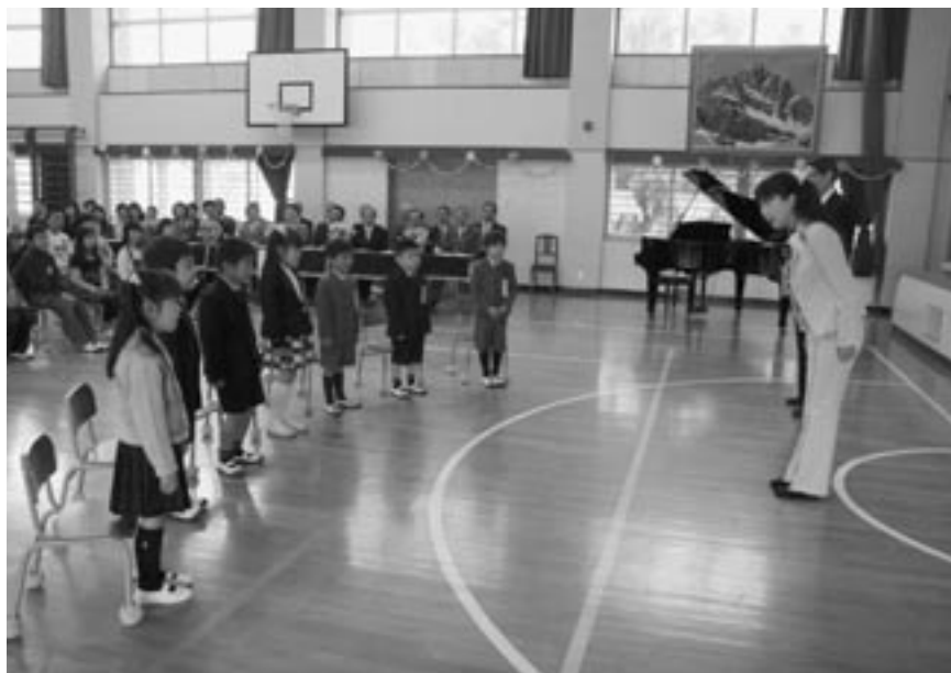
▲内浦小学校。担任紹介のシーン。大きな声で「よろしくお願ひします！」