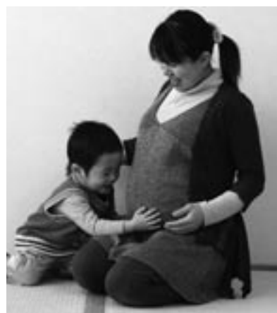
◀妊婦健診が14回無料に