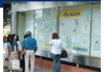
▲駅前ぎやらりー。足を止め、熱心に作品を見入る人たち