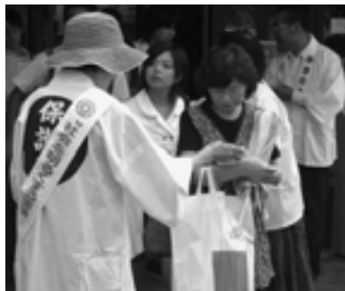
▲7月3日、遠賀保護区保護司会の会員が町内で啓発運動を行いました