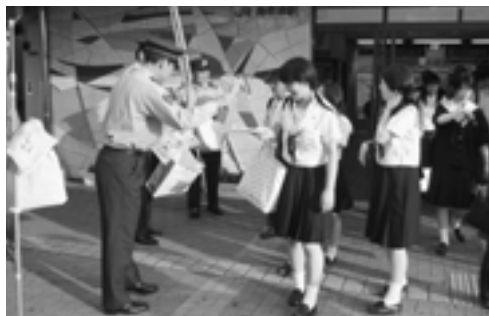
折尾署警察官約10人がチラシを配布しました

岡垣町のイメージキャラクターであるセレスとセレナも参加し、不審船や密航者に関する啓発チラシを駅利用者に配布しました。