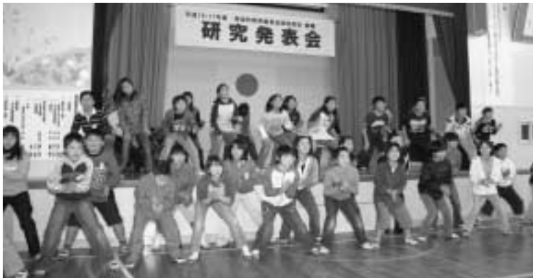
▲児童による詩・音楽・ボディーパーカッションの発表も行われました

IT社会に生きる子どものコミュニケーション能力の向上を目指した教育活動の創造という研究テーマで発表会が開催されました。各学年の公開授業も行われ、参加した学校関係者や保護者約230人は、授業を参観し、研究発表にも熱心に耳を傾けました。