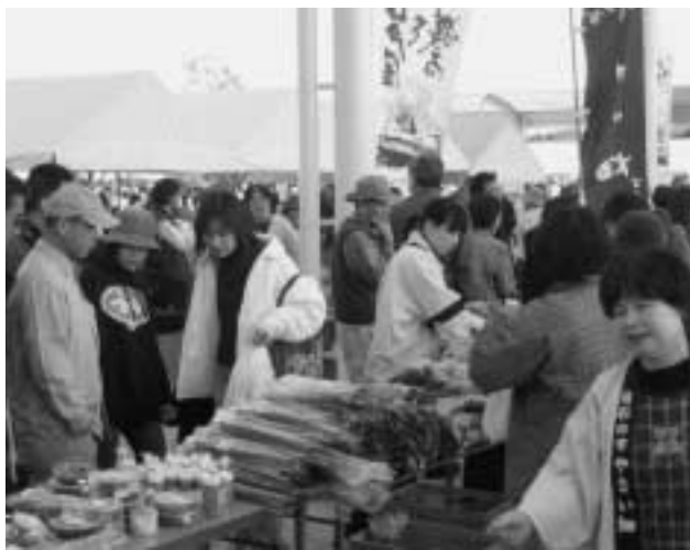
▲岡垣町の農産物や海産物も販売されました

地域で採れた新鮮な農産物や海産物の出店などがあり、多くの家族連れなどで賑わいました。生産者と消費者の交流も行われ、楽しい一日となりました。