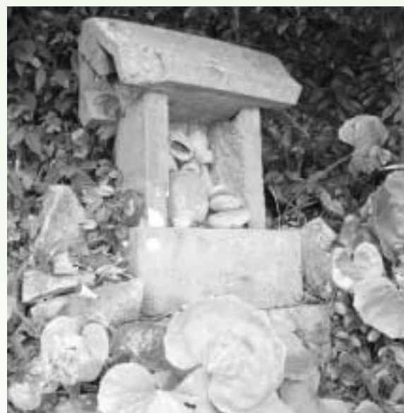
野仲家屋敷の庭にある猫搔ノ祠

だが、義久と父晴久の代から毛利氏と拮抗して戦が続く、義久はついに居城富田城(別名月山城)で敗れ、