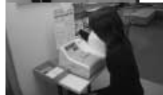
▲中央公民館に設置された自動血圧計