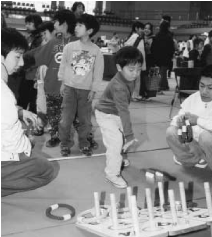
▲こどもまつりのように、住民が事業の企画から実施を主体的に行うことができる提案公募型事業が始まります

が担っていた部分を地域住民が担うには時間が必要だ。協働に至るまでの意識を向上させる取り組みから始めるべきだろう。