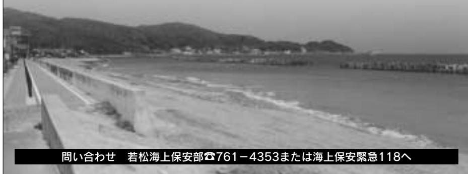
問い合わせ 若松海上保安部☎761-4353または海上保安緊急118へ

青く美しい海を未来の人たちに残すことは、現在の私たちの責任です。海上保安庁では、6月5日(土)から11日(金)までを海洋環境保全推進週間として、「未来に残そう青い海」をスローガンに、海洋環境保全運動を推進しています。海にごみを捨てている人を見たり、油が浮いているのを発見した場合は通報してください。みなさんも、美しい玄海灘・響灘とその海岸を守るため、ごみを捨てないようにしましょう。