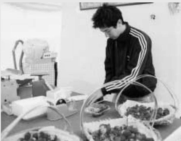
あまりにもおいしかったので、容器ごと食べてしまいそうでした。

いちごハウスに行ったことがありますか?岡垣で一番かわいいところだと思います。最初に入ったときはびっくりしました。超ピンク!って感じてました。ピンク色のカーテンと花がたくさんあり、ピンク胸当てつきエプロンを着ているとてもフレンドリーな女性がイチゴを箱に詰