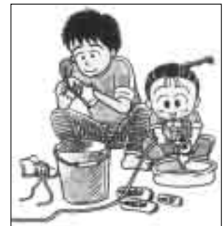
自分でできることは...