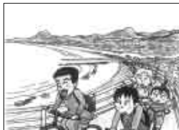
家族でサイクリング

2学期から毎月第3日曜日に、「家庭の日」を実施します。家庭の日は特別な日ではありません。家族が楽しく触れ合える機会を多く持ち、きずなを深め、家庭の役割を見直そうというのが願いです。