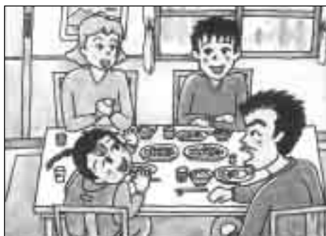
夕食時の楽しい会話