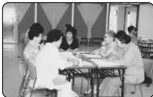
問い合わせ 企画政策室企画係(女性政策担当)