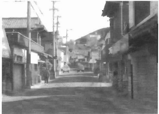
屋外広告物の規制について（岡垣町の該当部分のみ抜粋）