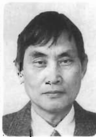
無所属 新海老津区

緑豊かな自然に恵まれた私たち岡垣町の生活環境を守り心豊かな「人づくり、町づくり」に新人議員として勇気を出し、何事にも誠実、実行力をモットーに取り組みます。