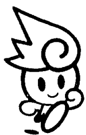
(マスコットマーク)

パピリオンからミュージカルまで、子供も大人も楽しめるファンタジックな夢空間。今年の夏、「世界・焔の博覧会」行ってみませんか。