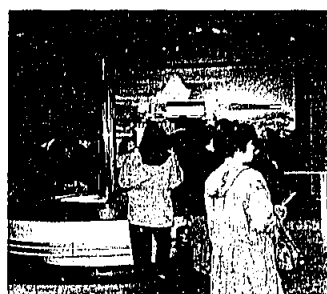
昨年のバスハイク(小倉城資料館)

今回は関門地域の文化財を巡ります。 とき 3月31日(日) 午前9時(役場集合) ところ 下関考古博物館・赤間神宮・門司港レトロ地域など 募集人員 八十人 参加費 大人二千円。小学生まで千円