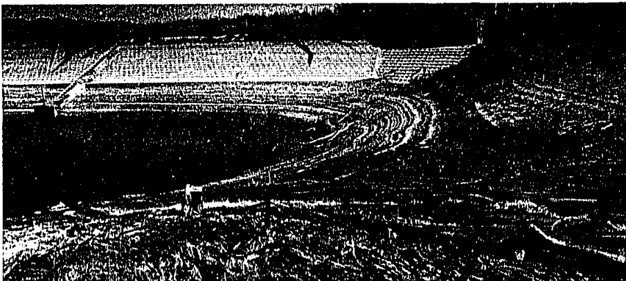
(干あがった門田ため池)

8月8日に、岡垣町干ばつ応急対策本部を設置し、切迫した水不足に対処するため、下水処理水をため池へピストン輸送するなど、農業用水の確保に懸命です。