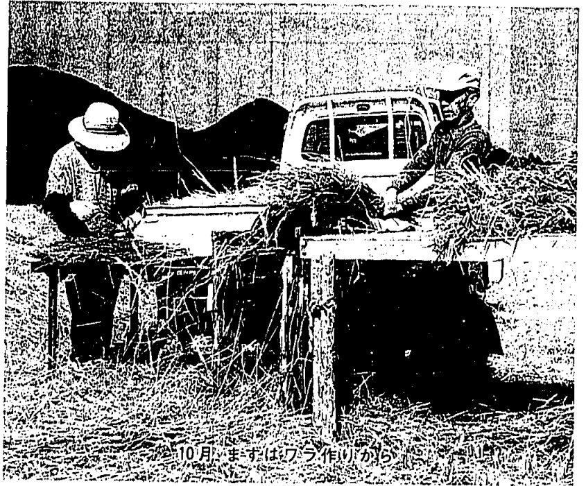
10月、まずはワラ作りから