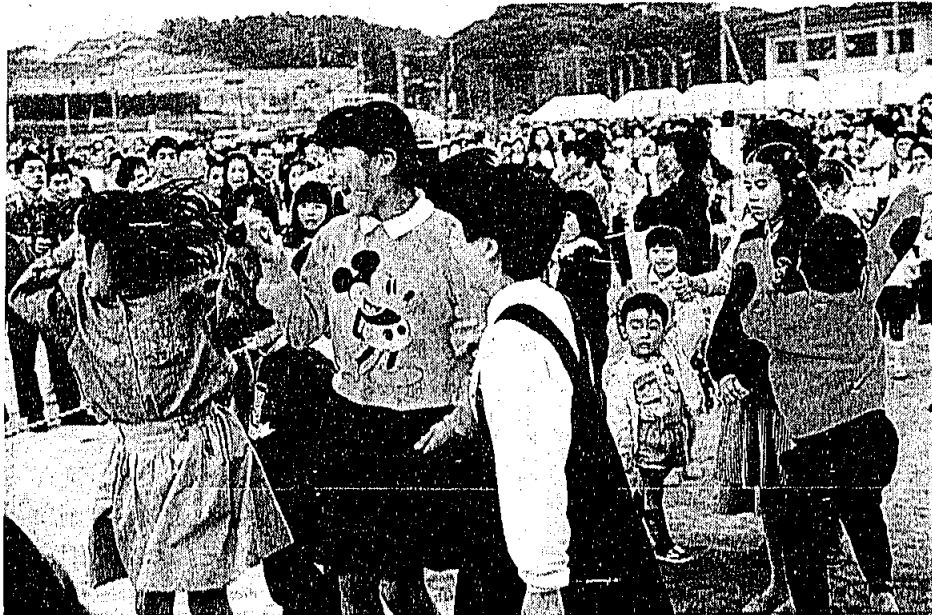
◁ やった!! ウルトライクス大正解