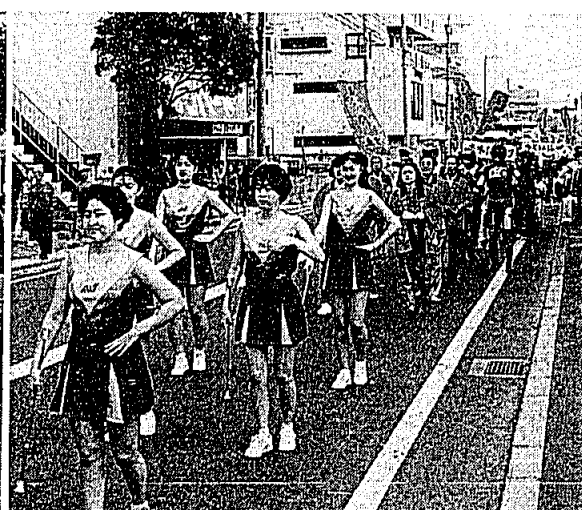
△ まつりはやっぱりパレードだ!!