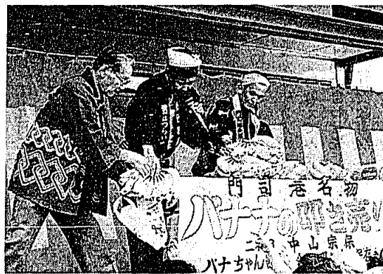
△ 名物バナちゃん節