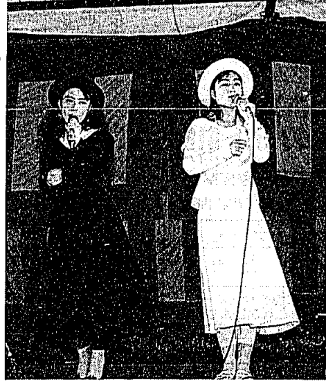
▷ 気持ちよかった。のど自慢大会