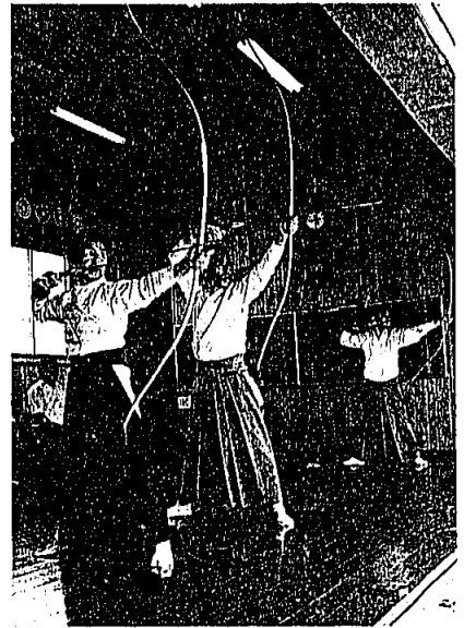
▲ 3月18日 町民弓道場