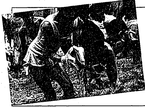
7月30日 サカナつかみ「オットとと、大丈夫？」

七月二十九日、三十日の二日間、埋蔵文化財分室において「親子考古学教室」が行われました。初日は発掘された土器片を水洗いし、二日目は土器の形に復元する作業です。初めての経験に親子で大はしゃぎ。「うまいわねえ」「お母さん、ちよっと押さえて」など親子で協力しながら楽しい二日間を過ごしました。