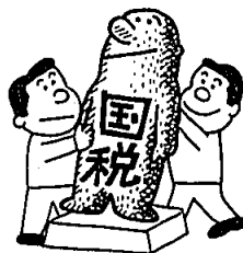
税を知る週間 (11月11日～17日)

応募締め切りは昭和六十三年十 一月三十日(水)です。 詳しくは、岡垣町東部公民館・ 中央公民館・役場社会教育課にパ ンフレットをおいています。