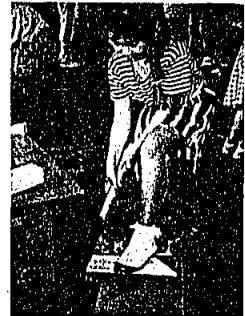
正しい「のこ」の使い方