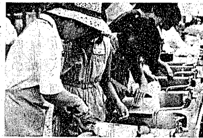
むずかしいな うまくできたかな

の元気な声が響いていました。テントを設営したり、お母さん に手伝ってもらった夕食作りと大奮闘の子供たち。夜はキャンプ ファイヤーをして、心ゆくまでキ ャンプ生活を楽しんでいました。