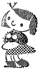
福岡県教育委員会 岡垣町教育委員会

の一生を大きく左右するなど聞いては、心配や不安もひとしおではなからうかと拝察も致しております。福岡県教育委員会では、市町村教育委員会や関係機関と協力して、昭和48年度から「家庭教育（幼児期）相談事業」を行なっています。 この事業は、3歳児をおもちのおとうさん、おかあさんに、心理学、幼児教育、医学などの専門家の協力で、子どもを育てていくうえの参考になる情報や資料を提供しながら育児上、教育上困っている問題にもお答えしていただくというものです。 この事業が、少しでも皆さんの子どもを正しく育てていくうえの参考になれば、関係者一同これにすぎる喜びはないと思っております。 なお、この相談で通信をお送りする方々は、次の期間に生れたお子さんを長子におもちのご両親です。