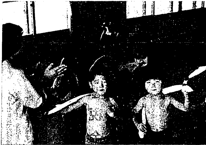
岡垣保育園児寒風まさつ

昭和五十年年度保育所入所受付を左記の要領で行います。 一、入所申込先 役場 民生課 二、入所人員 一六〇名 (岡垣町保育所一〇〇名、中部保育所六〇名；吉木旧役場跡建設中) 三、提出書類 一、保育所入所申請書 二、源泉徴収票又は勤務証明書 三、提出書類 四、内職証明(内職の斡旋先か)