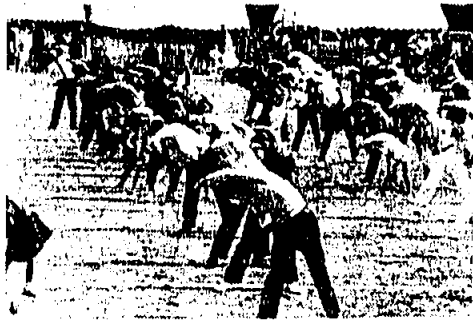
又七十才を越えた暇たきり老人は二十万人を越えるといひ、農村

昭和二五年に四兆円位しかなかった国民総生産が、四五年の推定では七〇兆円十八倍に達しようといわれるくらい、今や日本は成長経済を高らかに歩いています。 が反面一日平均六三八万人の人が病院の門をくぐり、国民総医療費は昭和四四年度で実に二兆円、国民一人当り約二万円にふくれ上っています。