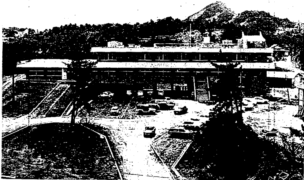
完成 した 新 庁 舎

その町の象徴である庁舎が、当岡垣町におきましては長年の風雪にたえて久しく老朽その極に達し、町政の拠点としての性能にさへ