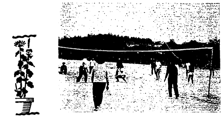
海老津のバレーボール

昔はよく遊び、よく遊べ、勉強したら遊ぶところが許された。働かざるもの食うべからず、働くことは美德で遊ぶことを罪悪視した。レジャーや遊びはレクリエーションに對する考えは変わってきている。レジャーは余暇と解釈され、それは適当ではない。科学が発達し、人間の物質的生活は豊かになつたが、人間が機械から使われ、人間疎外の時代になってきている。こんな時代のレジャーは自己完成の時間、生き生きとした生活のための時間と考えるのが妥当と思つた。だからレクリエーション、辞書には「仕事のひまに楽しむ娯楽」と書いてあるが、今は「仕事などから解放された自由な時間」に 昔はよく遊び、よく遊べ、勉強したら遊ぶところが許された。働かざるもの食うべからず、働くことは美德で遊ぶことを罪悪視した。レジャーや遊びはレクリエーションに對する考えは変わってきている。レジャーは余暇と解釈され、それは適当ではない。科学が発達し、人間の物質的生活は豊かになつたが、人間が機械から使われ、人間疎外の時代になってきている。こんな時代のレジャーは自己完成の時間、生き生きとした生活のための時間と考えるのが妥当と思つた。だからレクリエーション、辞書には「仕事のひまに楽しむ娯楽」と書いてあるが、今は「仕事などから解放された自由な時間」に