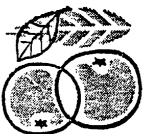
は葉の裏にコナジラミも葉の裏で蟻殻内に、サンホーゼは葉や枝先で越冬しているのが多いから、枝先の裏まで完全にかかるようにする。

撒布方法は、他の殺虫剤と同じで葉の表と裏にたっぷりかかるようにする。ミカンサビダニは芽の間にヤノネカイガラムシ