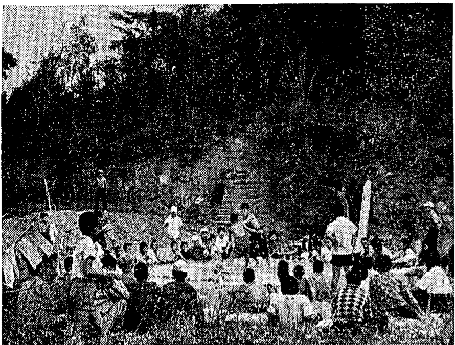
金毘羅様子供相撲