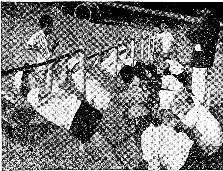
内浦校 スポーツテスト