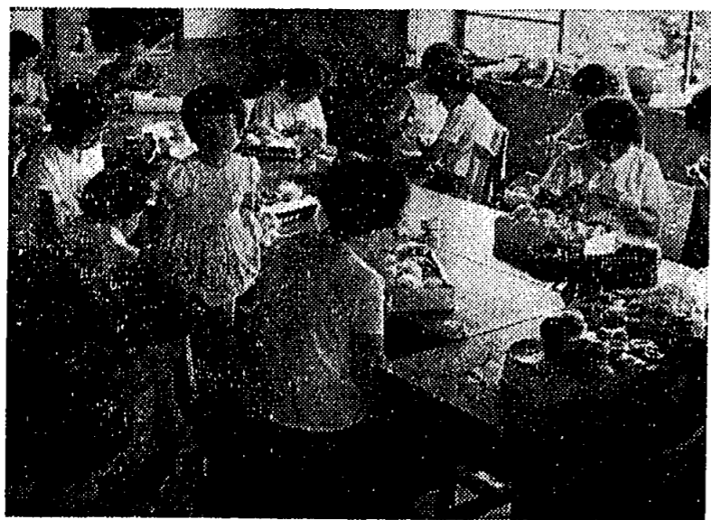
婦人会手芸講習会

例えば、子供が危険な場所で遊んでいようが、余りおもわしくない遊びをしていようが、「ひとの子」だからと、見過ごされることが多いわけです。又自分