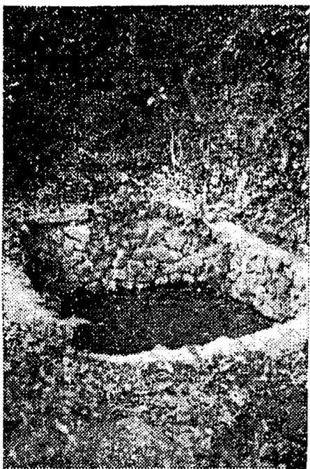
(上)神の池 (下)大年神社

大波津(昔神功皇后御征韓の御、大小の旗を立てられたので大旗、小旗といったが、今は訛って大波津、小波津という)にある。祭神は素戔嗚命の御子、大年神で、相殿に素戔嗚命、海童神を祀る。 神功皇后が三韓より帰られる時、此所で年を越されたので、大歳(おととし)の神を祭ったという。その為鳥居には歳越神社と刻みつけたこともある。