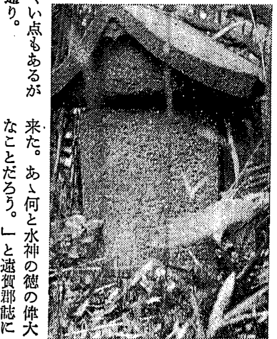
来た。あゝ何と水神の徳の偉大なことだろう。」と遠賀郡誌にも嘉永五年の夏は早魃と著してあるが、九州全域が全国的の早魃だったわかからず、又前記の祈禱でどの範囲まで雨がふったのか分らないが石祠の裏に著されている。龍照院、金龍院、快教院、安道院——修験中が建立された点からみると、相当広範囲の地域から寄って祈禱し、広範囲に亘って雨が降っただろうことが想像される。

その表と裏に字が刻んであるが、年月が経っているので、全然見えない字もあるのと、漢文で書いてある