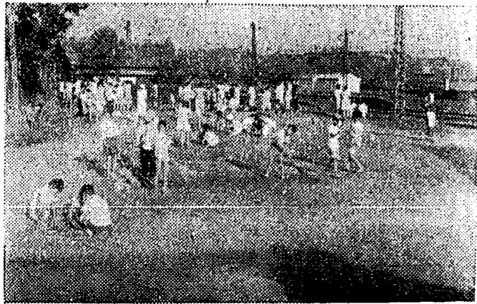
上海老津広場清掃

八月二六日区長さんや各界の 代表者寄って頂き打合せをした が、約半数が欠席、その後実施 計画書を出してもらったが、そ れも半数しか出ていないので、 全町の様子は分りかねるが、今 後とも継続をお願いします。 (才一日曜日の早朝雨天の場合 は才二日曜日に延期のこと)