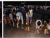
灯笼祭り(金明竹かご)