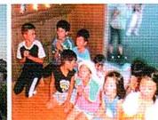
子供会のお地蔵様