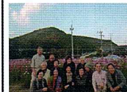
コスモスの種まき