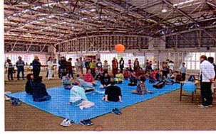
シッティング・風船バレーボール