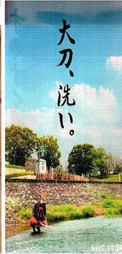
刀を川で洗った武将