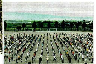
大刀洗町の田園風景