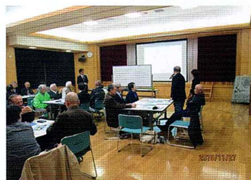
憩いの園大堰交流センターでの研修の様子