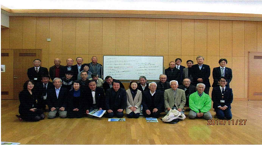
視察研修記念集合写真（憩いの園大堰交流センター）