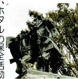
大刀洗公園の菊池武光像