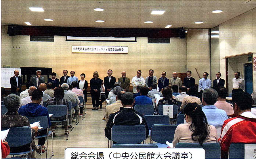
総会会場（中央公民館大会議室）