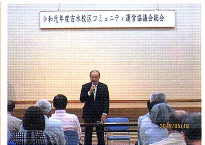
宮内町長のご挨拶

吉木校区コミュニティでは、今まさにこの課題について取り組んでいます。自治区の活動も大切ですが、校区コミュニティの活動にもご理解いただきご支援をお願いいたします。