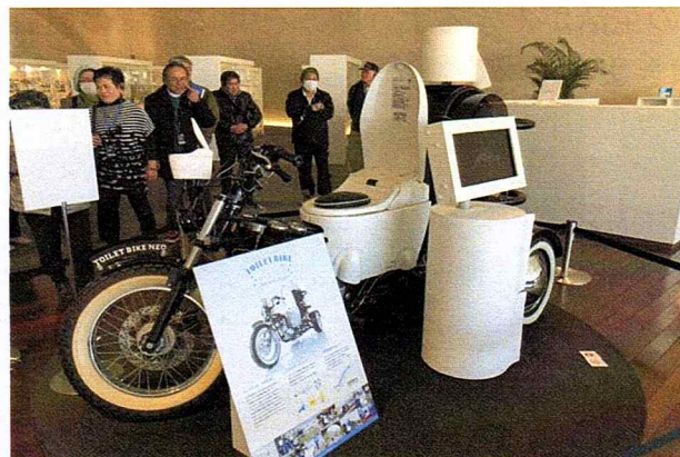
TOTO ミュージアム (小倉北区)