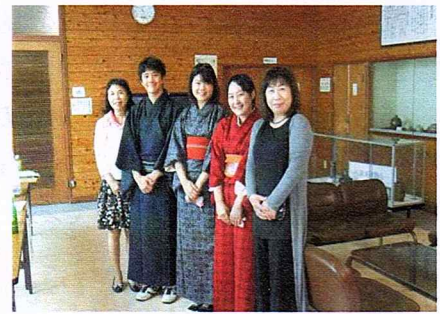
教育大落語研究部員