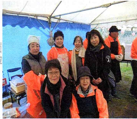
春まつり 焼きそば隊