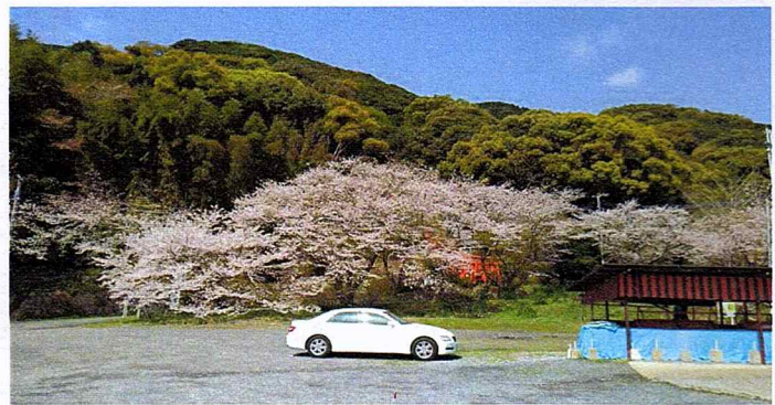
令和2年3月29日撮影 成田山道路