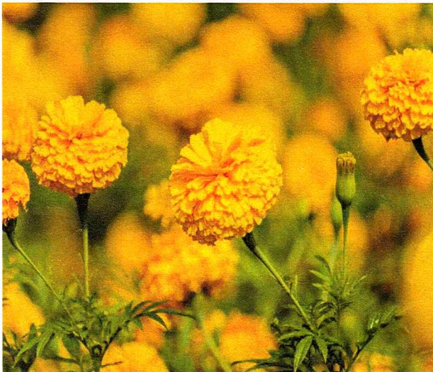
ディモルフオセカ(和名 アフリカキンセンカ)