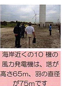
海岸近くの10機の風力発電機は、塔が高さ65m、羽の直径が75mです

講師は、宮城県で東日本大震災を経験し、移住先の熊本でも震災に遭っている防災士の柳原志保氏でした。毎年日本各地で起こる自然災害は、いつ、どこで、誰が遭遇するのか分からないのが現状です。