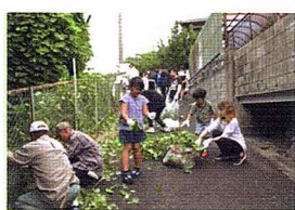
フェンスからツタをたくさん取りました！