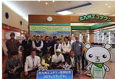
北九州エコタウンへの視察研修会修

★令和元年9月26日にカワセミ号に乗って、北九州エコタウン見学に行きました。参加者は15名でした。エコタウンの事業説明と家電や自動販売機のリサイクルを見学しました。リサイクル工場とはいえ、採算が取れないと存続できないという事でした。