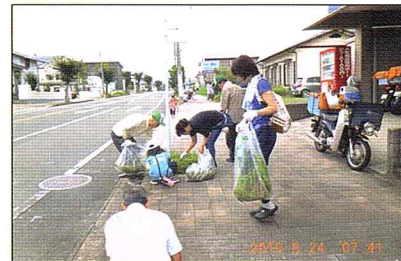
みんなで協力しました(高尾区)