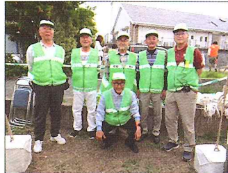
パトロール参加者

5月に矢矧川沿いで開催された「えびつほたるのタベ」において、安全・安心部会が防犯パトロールを実施しました。今年度は、ステージでの催し物はありませんでしたが、キッチンカーと出店がありました。