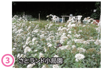
③ さとランド小局園