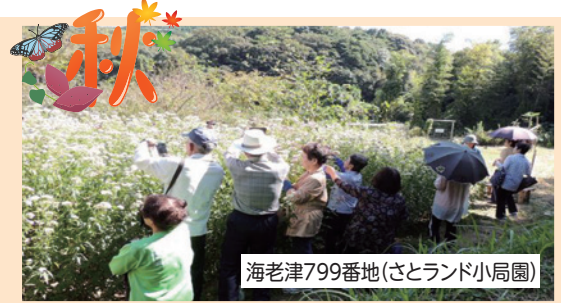
海老津799番地(さとランド小局園)

さとランド小局園には、春には写真のスイゼンジナに吸蜜で集まります。 【時期】5月19日中心に5月15日～5月26日(最早5月7日・最遅6月14日)最多飛来:15頭(2020年5月24日)