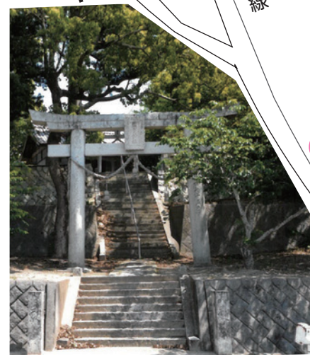
③ 須賀神社 すさのおのみこと 推定 須佐之男命 神社前の道が唐津街道になっており 岡垣四国霊場第72番札所 (ご本尊:大日如来)となっています。