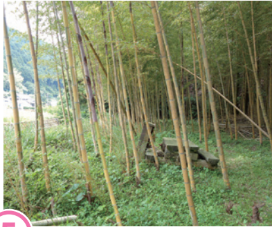
もうそうきんめいちく 孟宗金明竹

5、6月に節の下が黄色と緑色にくっきりと鮮やかになります。県でも珍しい群生指定地域に指定されています。