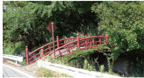
ちたるがわ 高倉神社にあり乳垂川にかかる橋

5、6月に節の下が黄色と緑色にくっきりと鮮やかになります。県でも珍しい群生指定地域に指定されています。